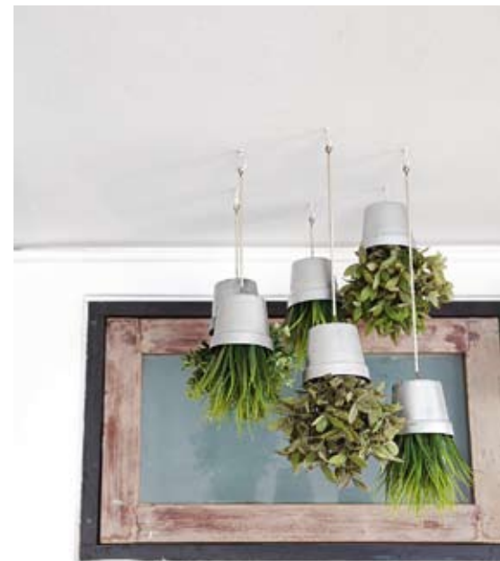
เพิ่มลูกเล่นด้วยการแขวนไม้กระถาง แม้จะเป็นต้นไม้ปลอม แต่อย่างน้อยก็ช่วยเพิ่มพื้นที่สีเขียวได้บ้าง

ณ ย่านริเวอร์วัลเลย์ยังคงพบเห็นตึกแถวเก่าสไตล์โคโลเนียลได้ทั่วไป แม้จะมีอาคารสูงและอพาร์ทเมนต์ขึ้นอยู่รายรอบ แต่ตัวอาคารก็ได้รับการอนุรักษ์เป็นอย่างดี