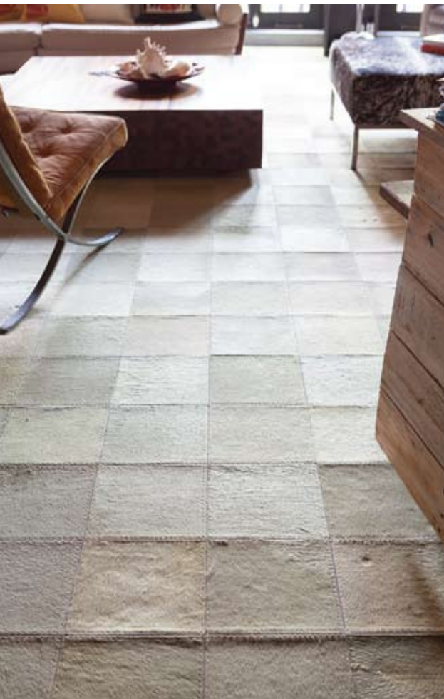
พื้นปูพรมหนังลาขนาดใหญ่ให้สัมผัสนุ่มสบายเท้า เหมาะกับห้องนั่งเล่นที่ต้องการบรรยากาศผ่อนคลาย

เจ้าของบ้านเริ่มสะสมของแต่งบ้านตั้งแต่สมัยอยู่ที่นิวยอร์ก นับถึงตอนนี้ก็เกือบจะ 20 ปีแล้ว ด้วยความเป็นนักเดินทาง เฟอร์นิเจอร์ งานศิลปะ และของสะสม แต่ละชิ้นล้วนมาจากแรงบันดาลใจ เรียกว่ามาจากทั่วทุกมุมโลกก็ว่าได้