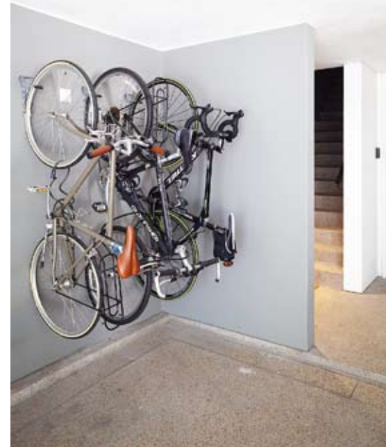
ผนังโล่งหน้าบ้านติดที่แขวนจักรยานแทนการจอดบนพื้นปกติ