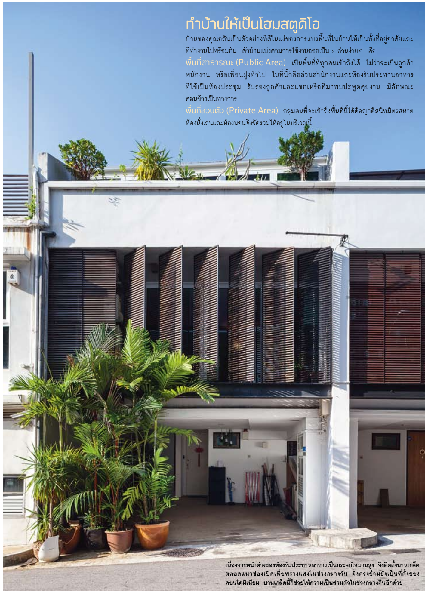
เนื่องจากหน้าต่างของห้องรับประทานอาหารเป็นกระจกใสบานสูง จึงติดตั้งบานเกล็ดตลอดแนวช่องเปิดเพื่อพรางแสงในช่วงกลางวัน ผังตรงข้ามยังเป็นที่ตั้งของคอนโดมิเนียม บานเกล็ดนี้ก็ช่วยให้ความเป็นส่วนตัวในช่วงกลางคืนอีกด้วย

พื้นที่ส่วนตัว (Private Area) กลุ่มคนที่จะเข้าถึงพื้นที่นี้ก็คือญาติสนิทมิตรสหาย ห้องนั่งเล่นและห้องนอนจึงจัดรวมให้อยู่ในบริเวณนี้