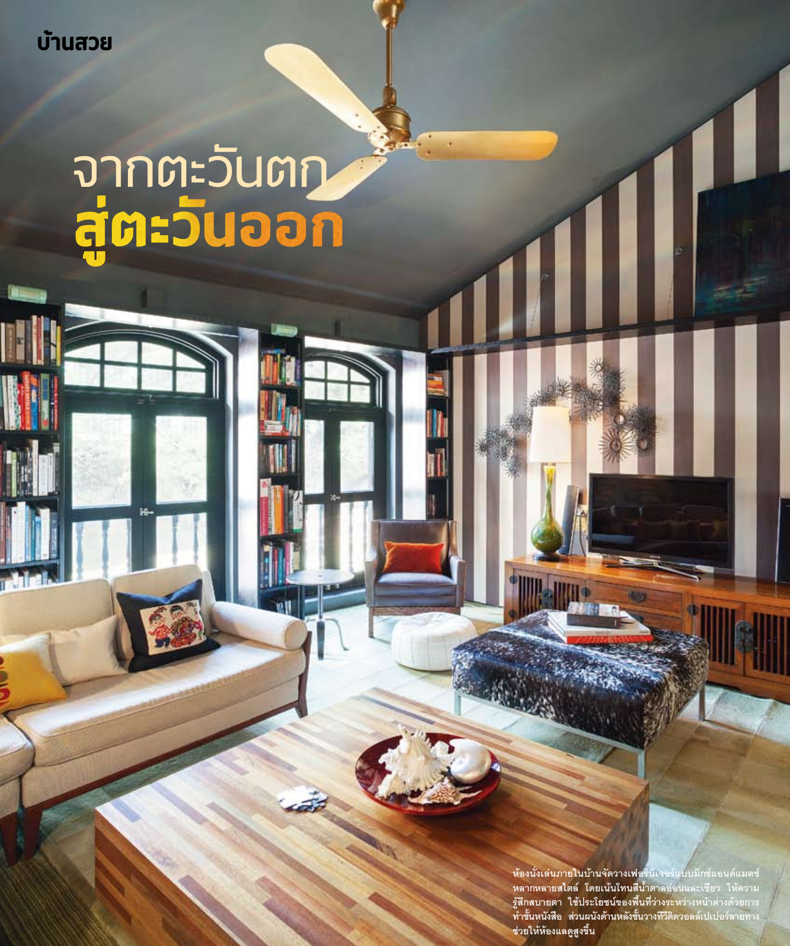
ห้องนั่งเล่นภายในบ้านจัดวางเฟอร์นิเจอร์แบบมิกซ์แอนด์แมตช์หลากหลายสไตล์ โดยเน้นโทนสีน้ำตาลอ่อนและเขียว ให้ความรู้สึกสบายตา ใช้ประโยชน์ของพื้นที่ว่างระหว่างหน้าต่างด้วยการทำชั้นหนังสือ ส่วนผนังด้านหลังชั้นวางทีวีติดวอลเปเปอร์ลายทางช่วยให้ห้องแลดูสูงขึ้น